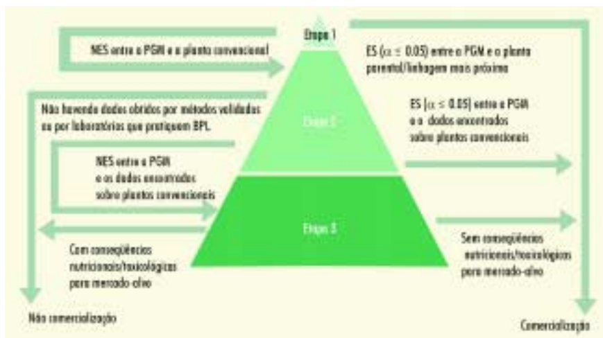
Figura 2: Casos onde não se constate haver ES entre PGMs e suas análogas convencionais (parental/linhagem mais próxima)

os mais próximos possíveis (FAO/OMS, 1996).