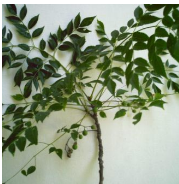
Figura 1b: Melia azedarach