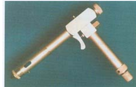
Versão portátil do equipamento de biolística para transformação in situ em condições de campo.