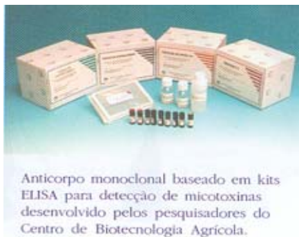
Anticorpo monoclonal baseado em kits ELISA para detecção de micotoxinas desenvolvido pelos pesquisadores do Centro de Biotecnologia Agrícola.

Balázs - Em 1996, o governo da Hungria aprovou a Lei de Proteção Ambiental, que contém um parágrafo proibindo a liberação no campo de organismos geneticamente modificados que não tenham registro. E, para conseguir registrar e comercializar os produtos transgênicos, as instituições têm que se submeter às obrigações impostas pela lei. Até o momento, nenhuma autorização para liberação de organismos geneticamente modificados foi negada, mas as empresas públicas ou privadas que desenvolvem pesquisas