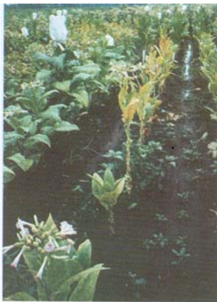
Plantas de tabaco transgênicas resistentes ao vírus Y da batata crescem em condições de campo (fila de trás). As plantas não-transgênicas são gravemente infectadas pelo vírus Y (fila central).

Balázs - Não há uma legislação específica na Hungria que regule essa matéria, mas nós fazemos troca de material genético com vários países, seguindo os protocolos estabelecidos pelas instituições ligadas à Organização das Nações Unidas - ONU. Os produtos transgênicos têm que passar por um processo de registro para obter o direito de propriedade industrial, já que envolvem patentes e isso impõe limites. Mas esse processo é controlado pelas