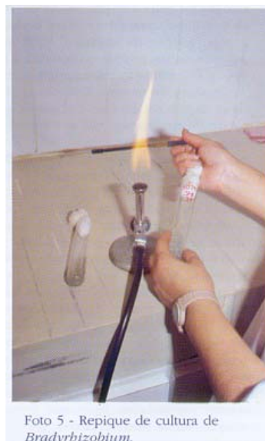
Foto 5 - Repique de cultura de Bradyrhizobium .

A tendência moderna no cultivo de leguminosas é o uso cada mais intenso do inoculante, por ser um produto natural, de alta eficiência e com uma relação custo/benefício muito favorável para o