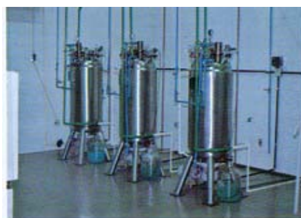
Foto 3 - Fermentadores utilizados na produção massal de Rhizobium/ Bradyrhizobium , visando a produção de inoculantes.

sofre redução de área ou o preço do produto final é desanimador, não estimulando o produtor rural a investir na sua lavoura. Atualmente, além das empresas nacionais, diversas marcas estrangeiras passaram a disputar o mercado brasileiro, especialmente as oriundas da área do Mercosul. A tecnologia usada na produção de inoculantes teve origem, inicialmente, na Secretaria de Agricultura do Rio Grande do Sul, baseando-se em pequenos fermentadores de vidro, com capacidade para 20 litros. No final da década de 60 e início da de 70, o Instituto de Biologia e Pesquisas Tecnológicas do Paraná (IBPT) desenvolveu uma tecnologia, inclusive com o desenho de equipamentos em maior escala, para 250 e 400 litros, que perdurou durante anos nas empresas brasileiras. Mas foram as próprias empresas que